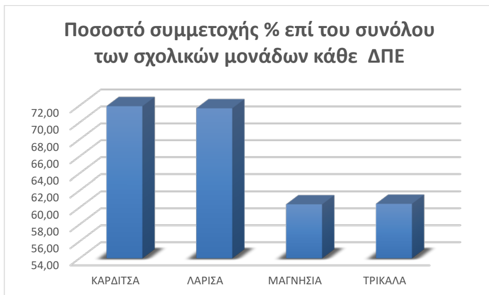
Γράφημα 2: Ποσοστό % των σχολικών μονάδων που κατέθεσαν προτάσεις επιμόρφωσης σε σχέση με το σύνολο ανά ΔΠΕ