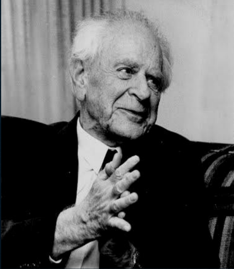
Karl Popper, 1902-1994

Στη ζωή υπάρχουν δύο είδη ανθρώπων: οι αισιόδοξοι και οι απαισιόδοξοι. Οι απαισιόδοξοι έχουν συνήθως δίκιο. Αν όμως η ανθρωπότητα έφτασε ως εδώ, αυτό το χρωστάει στους αισιόδοξους.