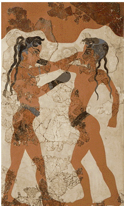
Εικόνα: Τοιχογραφία. Βρέθηκε σε κτήριο στη Σαντορίνη. Βρίσκεται στο Εθνικό Αρχαιολογικό Μουσείο (Αθήνα)