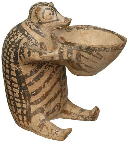
Εικόνα: Πήλινο αγγείο. Εθνικό Αρχαιολογικό Μουσείο (Αθήνα)

Παρατηρούμε τα τρία κυκλαδίτικα έργα τέχνης. Τι κάνουν αυτοί που εικονίζονται στα έργα αυτά; Διηγηθείτε ή γράψτε μια πολύ σύντομη ιστορία.